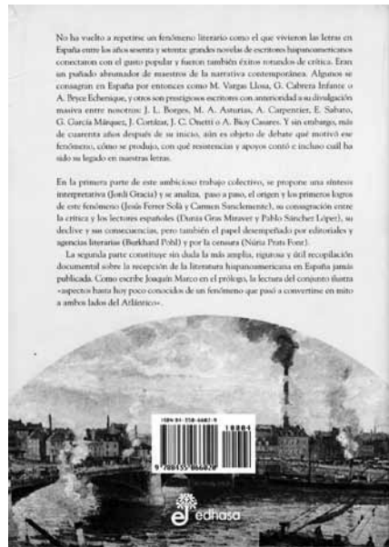
Fig. 10: Contratapa de La llegada de los bárbaros de Joaquín Marco y Jordi Gracia (2004)

El texto que ocupa la solapa trasera de todas las entregas de la colección tiende un lazo más estrecho y directo con la colección de los años 60, mencionando sólo al pasar a El Puente Literario: