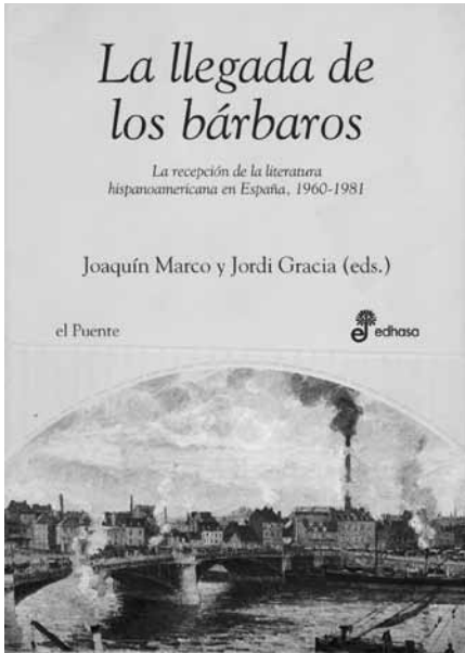
Fig. 9: Tapa de La llegada de los bárbaros de Joaquín Marco y Jordi Gracia (2004)