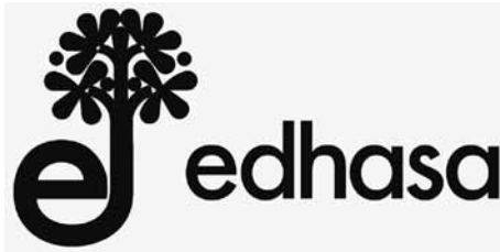
Fig. 13: Identidad marcaria y logotipo actual de Edhasa

En este punto, con La llegada de los bárbaros , una obra que precisamente se ocupa del impacto en la cultura peninsular de la literatura llegada del otro lado del Atlántico 65 , se detiene, tras casi medio siglo y acaso sólo por ahora, la historia de El Puente.