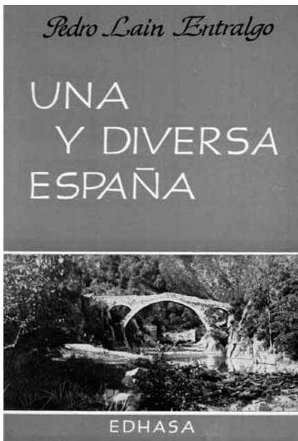
Fig. 3: Tapa de Apollinaire y las teorías del cubismo de Guillermo de Torre (1967)

Los veintiocho volúmenes se publicaron entre 1963 y 1968, año en abril del cual se imprime Una y diversa España de Pedro Laín Entralgo, última entrega de El Puente (fig. 4). También en este punto existen algunas inexactitudes de los estudios de la crítica, aun la más reciente. Así, por ejemplo, Fernando Larraz hace terminar anticipadamente la colección al situarla “entre 1963 y 1967” (2009a: 325), mientras que Joaquín Marco y Jordi Gracia la hacen empezar un año más tarde, es decir, “en 1964” (2004:87), y, más recientemente, el mismo Gracia junto a Domingo Ródenas la ubican en el periodo “entre 1962 y 1967”, es decir, adelantando en un año tanto su comienzo como su final (Gracia y Ródenas, 2011:168).