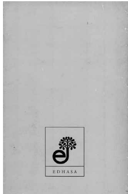
Fig. 6: Contratapa de Narraciones de la España desterrada de Rafael Conte (1970)

Si bien José-Carlos Mainer afirma que El Puente Literario “no llegó a tener más que un título: la excelente antología Narraciones de la España desterrada de Rafael Conte” (1998:416), lo cual es reafirmado por Manuel Aznar Soler al señalar que “[e] sta edición constituyó el volumen primero y único” (2002:257) de la colección, lo cierto es que en el marco de El Puente Literario se editaron un total de ocho entregas, numeradas correlativamente a partir de la quinta, entre 1970 y 1971. Puede que entre los factores que determinen la inexactitud citada se encuentre uno de los cambios que se produjo entre la colección dirigida por Guillermo de Torre y la que estuvo a cargo de Félix Grande. A diferencia de El Puente, El Puente Literario careció de un diseño editorial distintivo que la identificara exteriormente como colección (v. fig 6 y 8). Sólo