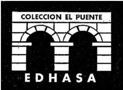
Fig. 11: Identificación formal de la colección El Puente (1963-1968)