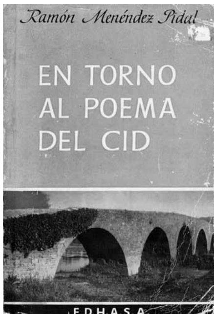
Fig. 1: Tapa de En torno al Poema del Cid de Ramón Menéndez Pidal (1963)