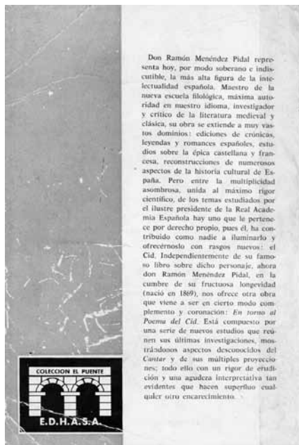
Fig. 2: Contratapa de En torno al Poema del Cid de Ramón Menéndez Pidal (1963)

En la tapa, sobre el fondo de un color pleno, está emplazado, centrado, en negro y tipografía caligráfica, el nombre del autor, y, debajo, el título del libro en blanco y tipografía de paloseco, y con una marginación variable. En la parte inferior, sobre la marca editorial —centrada, también en blanco y tipografía de paloseco— 18 , la fotografía en blanco y negro de un puente español perfilada por dos filetes blancos horizontales, superior e inferior, que la separan del fondo 19 . En la contratapa, la mancha tipográfica se ubica en el margen interior, compensada, en tipografía con remate, en negro sobre un fondo blanco; y en el margen exterior se repite el fondo de color de la tapa, en cuya parte inferior se emplaza la identificación formal de la colección,