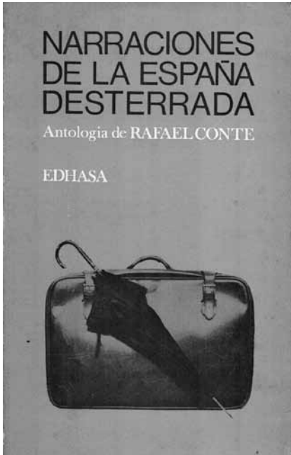
Fig. 5: Tapa de Narraciones de la España desterrada de Rafael Conte (1970)